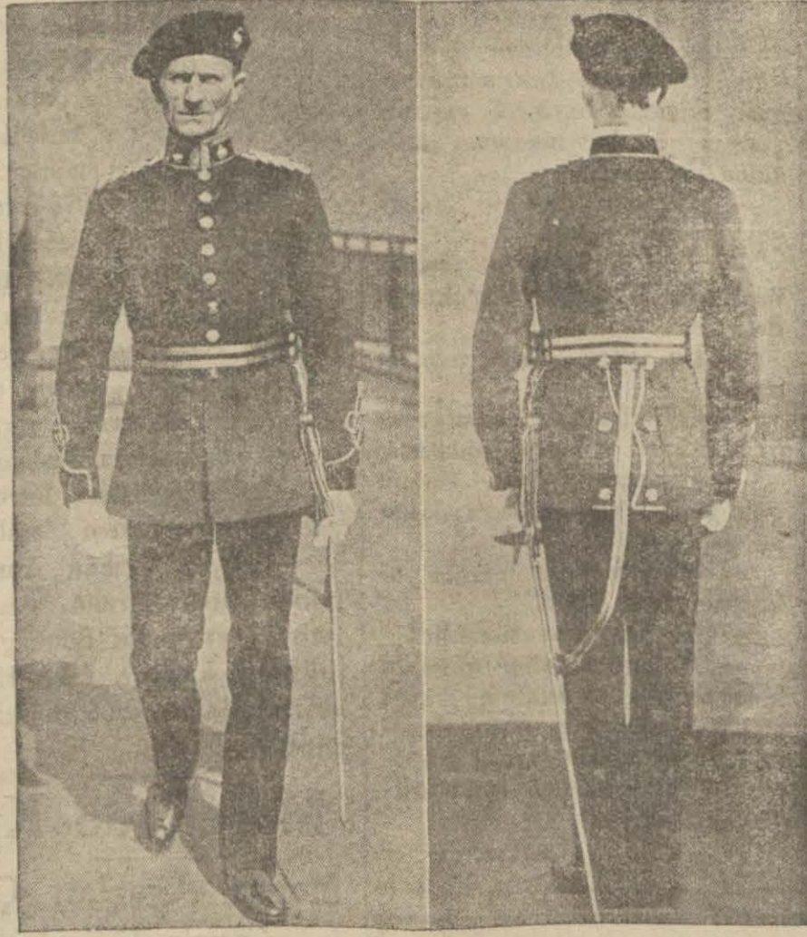
İngilterenin, tank kıtaatı zabitleri için kabul ettiği son kıyafet

Karar suretinde bundan başka ordunun, harici işlerin, mali işlerin, hazine siyasetinin tam bir kontrole tâbi tutulması istenilmekte ve yeni Yuvarlak masa konferansına iştirak edecek heyetin reisliğine tayin edilmiş olan Gandhi'ye karşı tam bir itimat izhar edilmektedir.