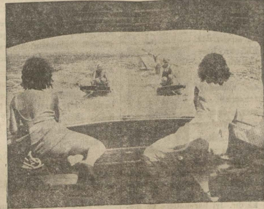
Kalifornyaaa havaları sıcak, sinema artistleri denizde eğleniyorlar