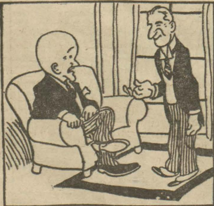
1: Amerika teğrifatçısı — Hasan Bey Reisicümhurumuz Mister Huver sizi davet ediyor, Türk Şarlosile konuşmak istiyor.