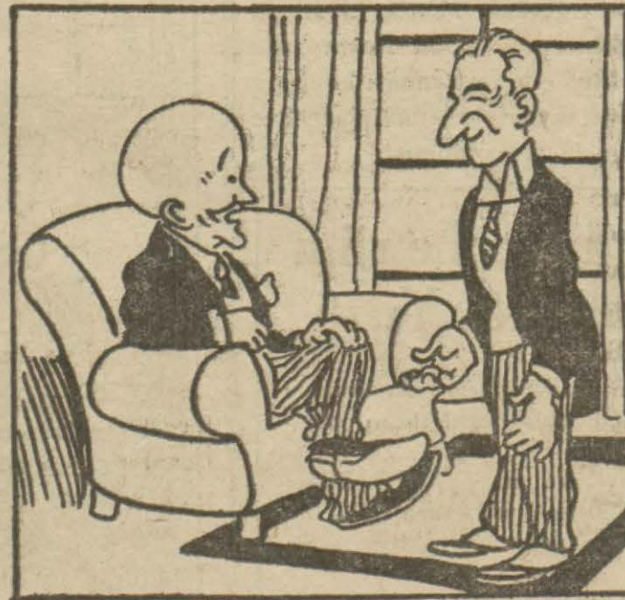
2: Amerika teğrifatçısı — Saat üçte "Vayt Havz", da, yani reisicümhur sarayında bulununuz. Saat üçü beş dakika, on iki saniye ve on yedi salise geçerken huzuruna gireceksiniz.