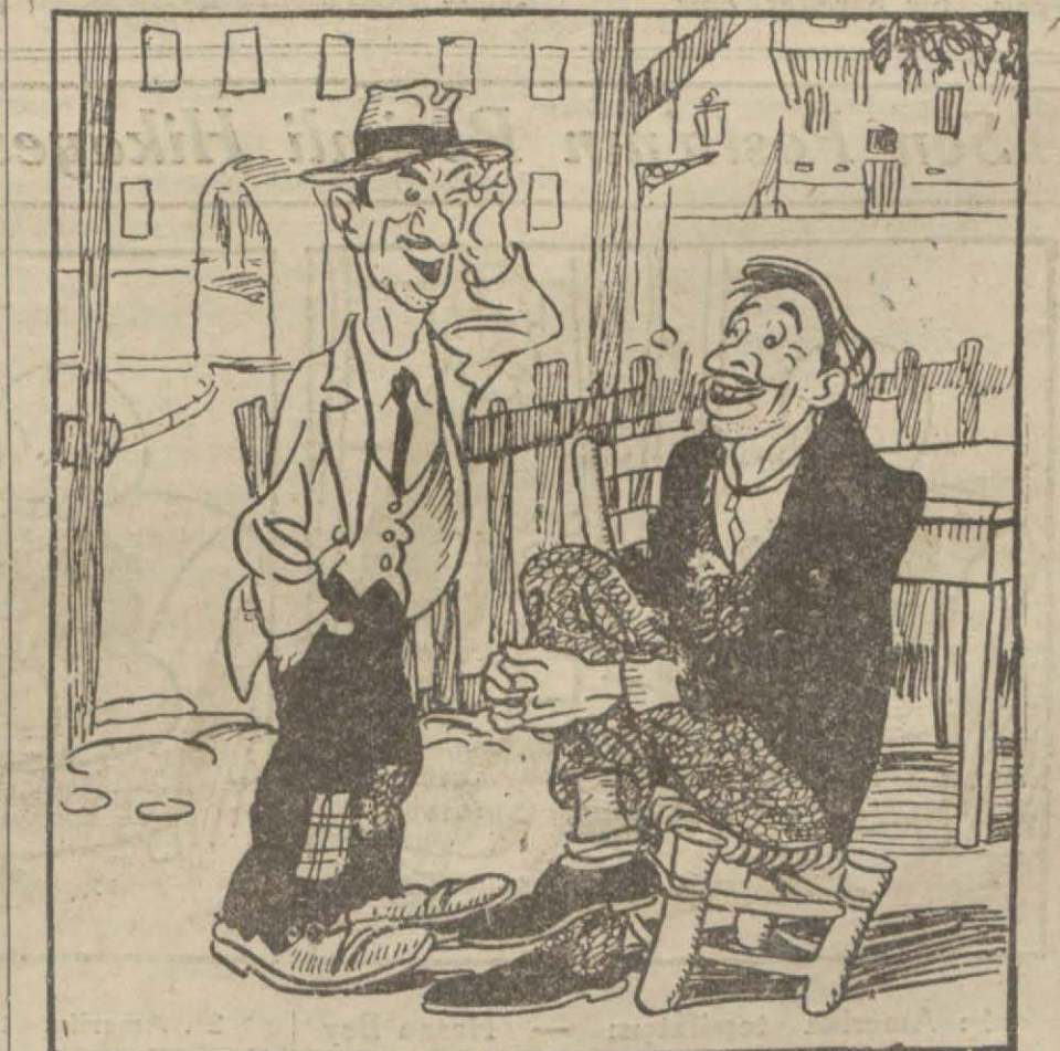
— Bir iş bulamadım, gitti! — İşsizler namına namzetiğini koy!